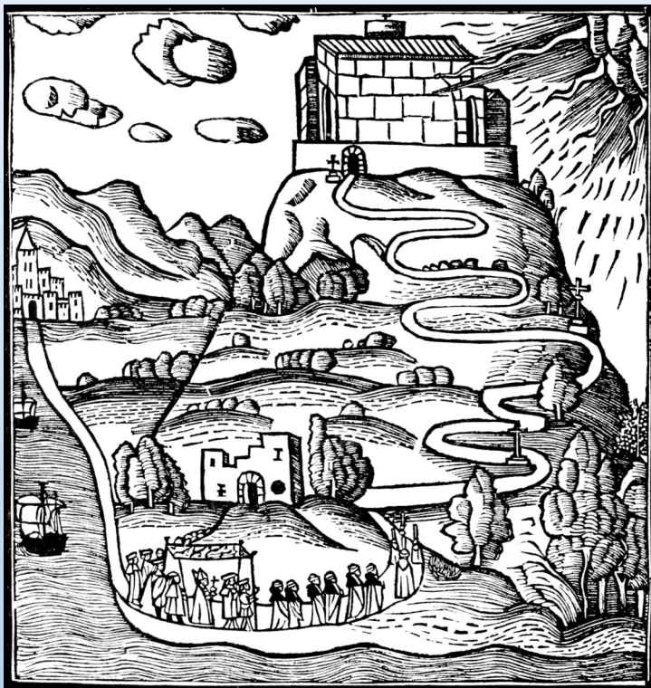
El Puig de Randa a l' Ars inventiva veritatis . Diego de Gumiel (1515).

En paral·lel a la consolidació de l'ermita del puig de Cura i els orígens de l'Escola de Gramàtica, es degué elaborar la llegenda de la cova, com el primer refugi i el més natural on Llull hauria madurat la seva vocació i compromís. El 1453, amb Pere Joan Llobet, hauria començat l'experiència de l'Escola. Durant el segle xv tan sols hi ha documentació relacionada amb les construccions del cim del puig de Randa. El 1509 apareix documentada per primera vegada l'existència d'una capella. Havien passat més de dos-cents anys des de la il·luminació de Ramon Llull.