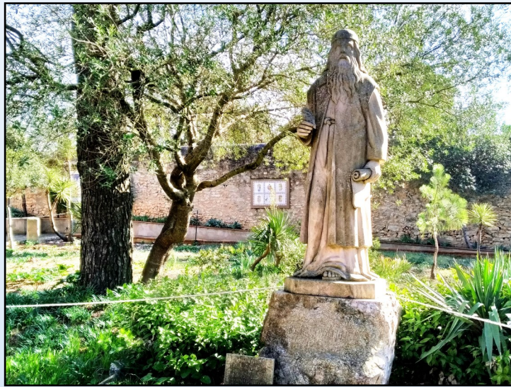
Estàtua de Ramon Llull al monastir de Cura.

L'agost de 1913, el bisbe Pere Joan Campins cedí el santuari de Cura als germans franciscans del tercer orde regular. El programa de restauració de l'indret lul·lià s'inicià amb la recuperació de l'espai de la Cova i ben aviat aquell lloc esdevingué punt de peregrinació del catolicisme illenc.