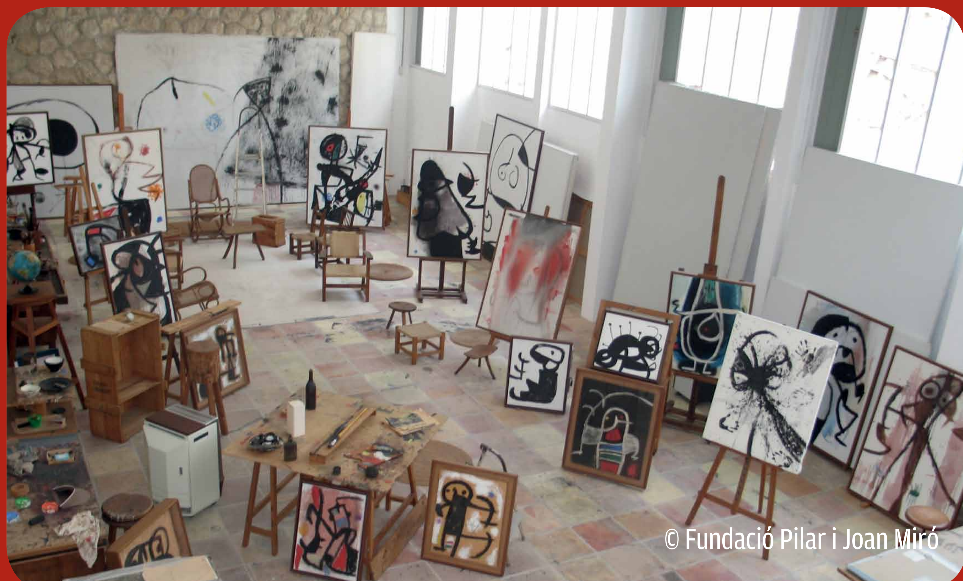
© Fundació Pilar i Joan Miró