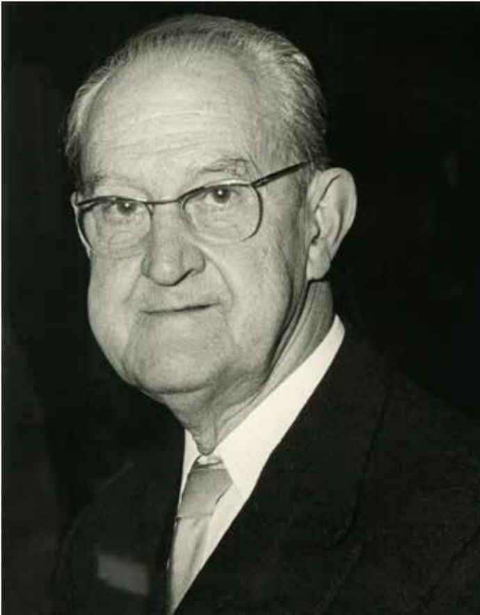
L'escriptor Guillem Colom, en una imatge de la dècada del 1970.