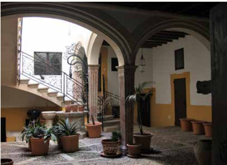
Pati de can Colom, al carrer de can Anglada de Palma.

I és precisament per aquest tarannà i per la seva coneixença, que, quan l'any 1950 es va declarar el dogma de fe de l'Assumpció de Maria, el poeta Colom va escriure ex professo la composició Tríptic de l'Assumpció , publicada llavors com un opuscle (125 exemplars). Ara es