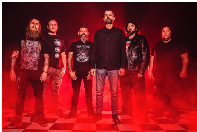
La banda Helevorn va incloure la Sibil·la al seu disc Aamamata (2019)

L'èxit del Cant de la Sibil·la com a representació genuïna de Mallorca ha donat lloc a tot un seguit de propostes de nova creació. Artistes de l'illa especialitzats en músiques modernes han presentat la seva proposta de la Sibil·la. Des de diferents vessants del jazz i del blues, la música electrònica, la fusió o la new age, la Sibil·la, durant els darrers temps, ha entrat a formar part d'àmbits escènics nous